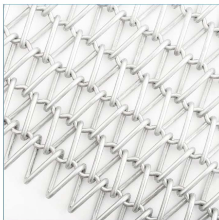
CON FILO A SPIRALE