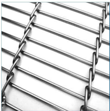
A BARRETTE INTRECCiate